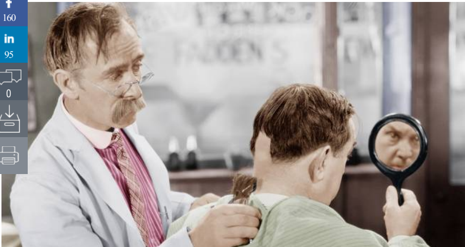
Apprendre de ses erreurs est le plus court chemin vers la réussite.